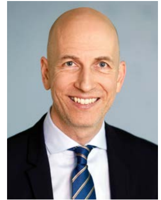
Univ.-Prof. Mag. Dr. Martin Kocher, Bundesminister für Arbeit

Die Kurzarbeit hat sich während der Krise als eine der wichtigsten Kriseninstrumente etabliert. In Kombination mit Weiterbildungsmöglichkeiten, die währenddessen in Anspruch genommen werden konnten, hat die Corona-Kurzarbeit Arbeitsplätze erhalten, Einkommen gesichert und die Chance auf Höherqualifizierung geboten. Die Inanspruchnahme von Qualifikationsmaßnahmen während der Erwerbstätigkeit wird generell entscheidend für die zukünftigen Jahre sein, um den Wirtschaftsstandort Österreich für