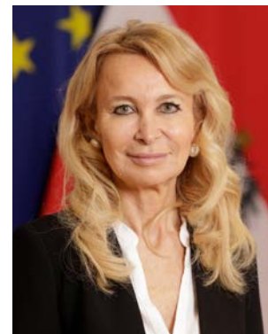
Dr. Antonella Mei-Pochtler, Sonderbeauftragte des Bundeskanzlers und Lei- terin des Strategiestabs ThinkAustria

Wir leben in einer Zeit des Übergangs im mehrfachen Sinn: Die Digitalisierung beschreibt einen Epochenbruch, vergleichbar mit dem Übergang zum Industriezeitalter. Was mit der Einführung von Industrierobotern und der Computerisierung der Büroarbeit begonnen hat, entwickelt sich mit der Plattformökonomie und dem „Internet der Dinge“ zum Übergang in eine neue Epoche: dem Hybrid-Zeitalter. Es verändert sich nicht nur