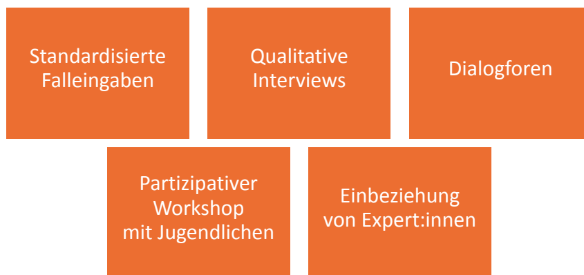
Abbildung 2 Empirische Forschungsmodule