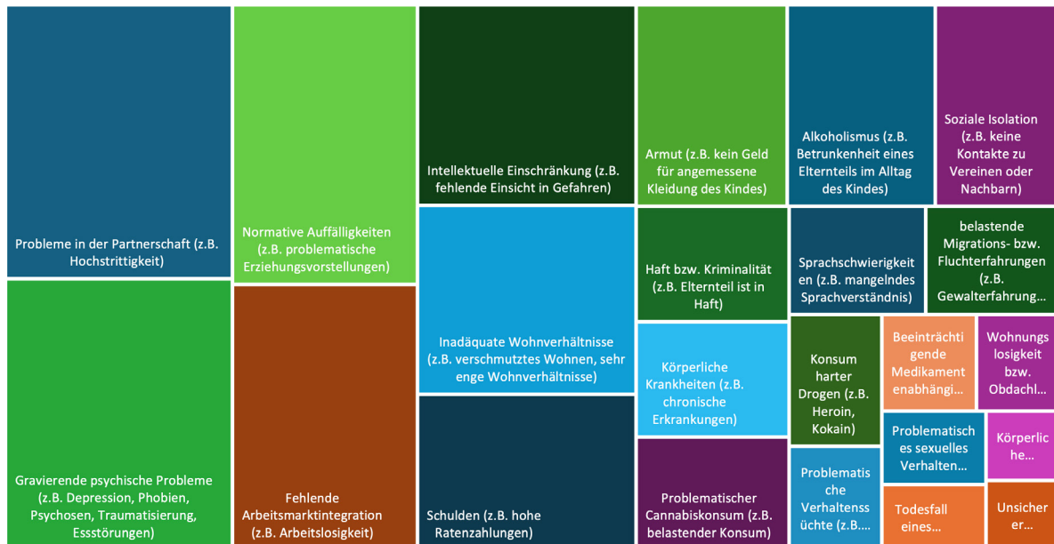
Abbildung 4 Sekundärgründe

Die vorliegende Abbildung 4 und die Tabelle 10 geben einen Überblick über die Häufigkeit verschiedener Sekundärgründe, die zu einer Betreuung in voller Erziehung führen können. Die Ergebnisse verdeutlichen die Vielschichtigkeit der Problemlagen, aufgrund derer Kinder und Jugendliche nicht bei ihren Herkunftsfamilien leben. Im Durchschnitt zeigen sich pro Fall 5,1 Sekundärprobleme. Es bestehen also in der Regel multiple Problemlagen bzw. eine Kumulation von Sekundärgründen.